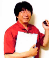
(“赤い”作業着で働いています)

ひろしま創業サポートセンター登録 創業サポーター、ミラサポ(中小企業庁委託事業)専門家登録(相談員)等